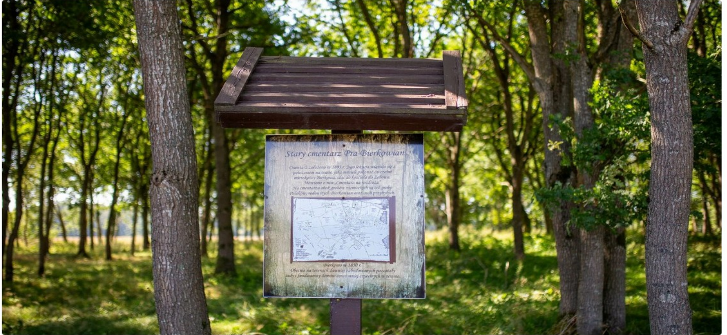
Zaniedbany cmentarz w Bierkowie. Łukasz Capar